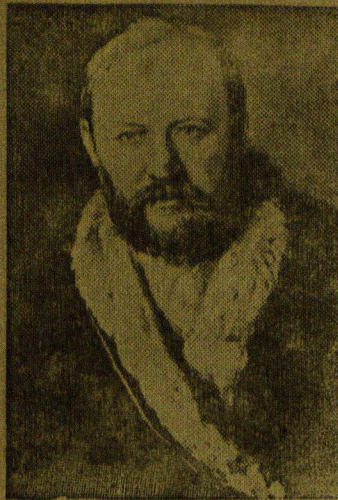
А. Н. Островский